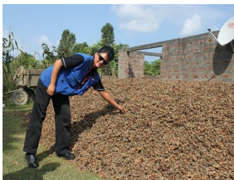
Десятки тысяч тонн фундука собирают с лета до осени каждый год.

Лицам, регулярно приезжающим в Абхазию позволено привозить с собой товары, но их часто просят платить пошлины на импорт в больших количествах. Таможенные пошлины и экспортные пошлины, собранные абхазскими де-факто пограничниками варьируются в зависимости от сезона и других факторов.