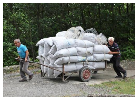
Каждый год, новозаготовленный фундук поступает непосредственно с ферм лесного ореха на наиболее высокооплачиваемые рынки.