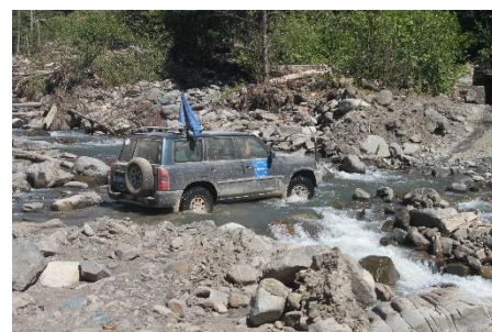
Наблюдатели из Полевого Офиса МНЕС в Зугдиди патрулируют в северной отдаленной и горной части зоны ответственности.