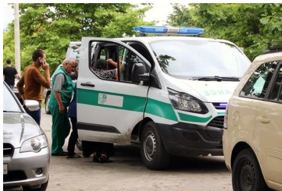
Экипаж машины скорой помощи с территории администрируемой Тбилиси забирает пациента из Абхазии после пересечения с целью получения медицинской помощи и услуг на контролируемом пункте пересечения Набакеви / Хурча

После того, как пациент пересек, его встречает экипаж машины скорой помощи с территории администрируемой Тбилиси, который продолжает путь в медицинское учреждение, в данном случае в больницу в Зугдиди.