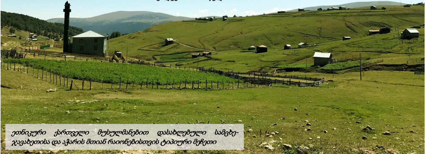
ეთნიკური ქართველი მუსულმანებით დასახლებული სამცხე-ჯავახეთისა და აჭარის მთიან რაიონებისთვის ტიპური მეჩეთი

გარდა ამისა, საქართველოში 19,000 კათოლიკეა, 12,400 - იეჰოვას მოწმე, 8,600 - იეზიდი, 2,500 - პროტესტანტი და 1,400 - იუდაიზმის მიმდევარი.