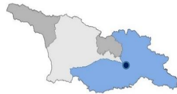
თანამშრომელთა რაოდენობის თვალსაზრისით მცხეთის რეგიონალური ოფისი მისიის სამი რეგიონალური ოფისიდან ყველაზე პატარაა, მაგრამ მისი პასუხისმგებლობის სფერო ყველაზე დიდია (ლურჯად მონიშნული).

გავლით რუსთავსა და აზერბაიჯანში სამხრეთ აღმოსავლეთით, კასპიის ზღვისკენ მოედინება. სამხრეთით სამცხე-ჯავახეთსა და შიდა ქართლში არის ეთნიკური სომხებისა და აზერბაიჯანელების დიდი დასახლებები. ოსების უმეტესობა სამხრეთ ოსეთში ცხოვრობს, სადაც ასევე რუსეთის მნიშვნელოვანი სამხედრო წარმომადგენლობაა.