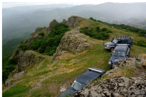
Великолепные достопримечательности в зоне ответственности Полевого Офиса Гори.