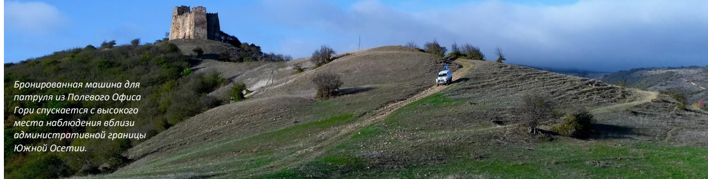
Бронированная машина для патруля из Полевого Офиса Гори спускается с высокого места наблюдения вблизи административной границы Южной Осетии.

Картли является центральным регионом Грузии. Вследствие исторических событий и его расположения, охватывающего верхние, центральные и нижние течения основной реки Мтквари, Картли был разделен на три региона – Земо Картли, Квемо Картли и Шида Картли.