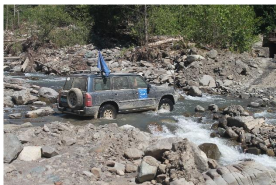
Наблюдатели из Полевого Офиса Гори проводят патрулирование в горных районах.

Несмотря на суровые ландшафтные условия, пейзаж потрясающе красивый, и помимо этого в Грузии есть четыре различных сезона.