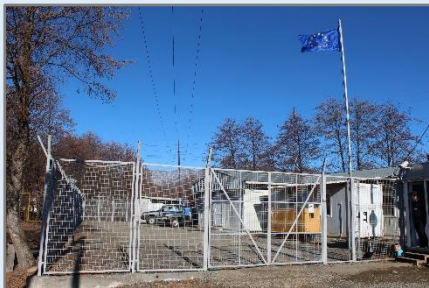
Передовая оперативная база в Сачхере установлена в контейнерах в огороженном и охраняемом комплексе.

Район, включающий в себя пункты пересечения на мостах Синагури и Карзмани и места наблюдения в Переви, Они и Чонто, представляет собой холмы и горы, великолепные ландшафты, исторические города и места, которые необходимо посетить всем, кто интересуется Грузией, ее людьми, историей и культурой.