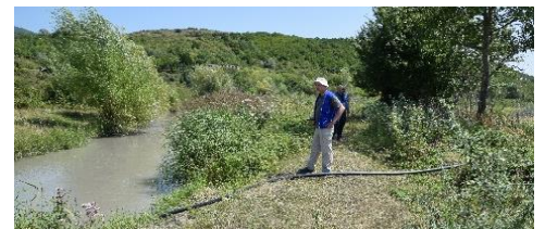
ირიგაციის ხელმისაწვდომობა გადამწყვეტია ფერმერების საარსებო გარემოსთვის. ადამიანის უსაფრთხოების საკითხებზე მომუშავე საპატრულო ჯგუფები აკვირდება სარწყავ არხებს პასუხისმგებლობის ზონაში.

გარდა ამისა, სკოლისა და ჯანდაცვის კლინიკის თანამშრომლებთან მჭიდრო ურთიერთობები სკოლის მოსწავლეების მიერ ადმინისტრაციული საზღვრის გადაკვეთასთან ან თბილისის მიერ ადმინისტრირებულ ტერიტორიაზე სამხრეთ ოსეთიდან სამკურნალოდ წამოსულ პაციენტებთან დაკავშირებული პოტენციური პრობლემების ადრეული დადგენის საშუალებას იძლევა.