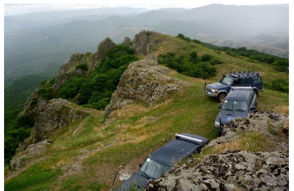
თვალწარმტაცი ხედები გორის რეგიონალური ოფისის პასუხისმგებლობის ზონაში.