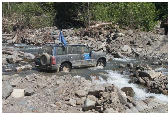
გორის რეგიონალური ოფისის დამკვირვებლები მთიან საპატრულო გასვლაზე

რთული რელიეფის მიუხედავად, ლანდშაფტი ულამაზესია, იმის გათვალისწინებით, რომ საქართველოში ოთხი განსხვავებული სეზონია.