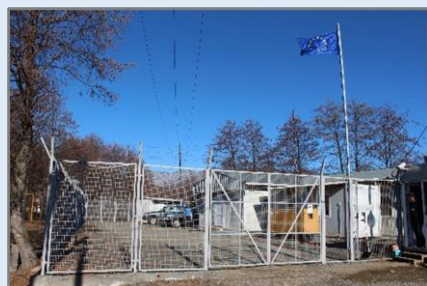
მეწინავე ოპერატიული ბაზა საჩხერეში განლაგებულია შემოღობილ და დაცულ ტერიტორიაზე.

ამ ადგილებს, მათ შორის, გადაკვეთის პუნქტებს სინაგურსა და ქარზმანის ხიდზე და დაკვირვების პუნქტებს პერევეში, ონსა და ჩონთოში, რომელიც მთებსა და ფერდობებზეა განლაგებული, ახასიათებს თვალწარმტაცი პეიზაჟები, აქ არის ისტორიული ქალაქები და ადგილები, რომელსაც აუცილებლად უნდა ეწვიოს ვისაც საქართველო, მისი ხალხი, ისტორია და კულტურა აინტერესებს.